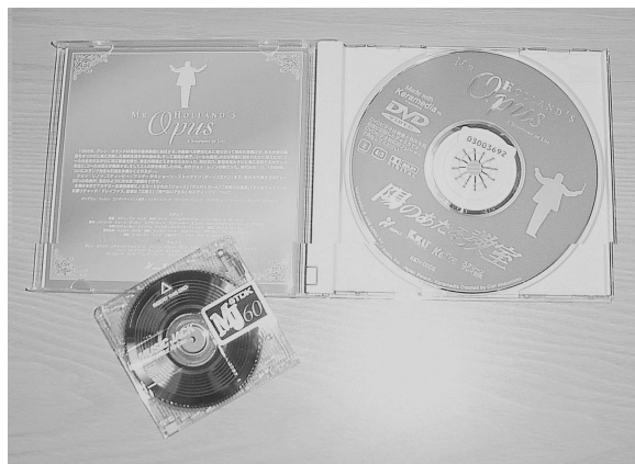
< DVD は CD と同形で、MD はさらに小さい >

的だが、市販教材を利用しない場合、自分で映画を聞き取ってスクリプトを作ったり、準備はなかなかたいへんである。ところが DVD なら適当な箇所マークをつけて繰り返し流せるし、たとえば日本語字幕で見せて内容把握、字幕を消してテープに録音させて聞き取り、原語字幕を出して答え合わせ、という方法も可能だ。一時停止状態でも映像、字幕が鮮明に映し出されるから、学生は画面を見ながら聞き取れなかった部分を確認できるし、教員も穴埋め用のスクリプトを原語字幕で確認しながら用意できる。こうした機能を利用して、特定の人物のせりふを消したロールプレイを可能にした「カラメディア」形式の DVD (『陽のあたる教室』米、1996) も市販されており、すでに全カリで所蔵している。